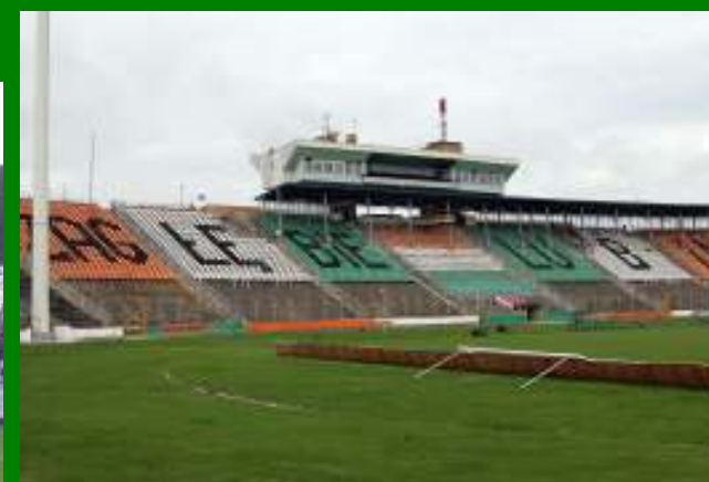
Stadion Zagłębia Lubin