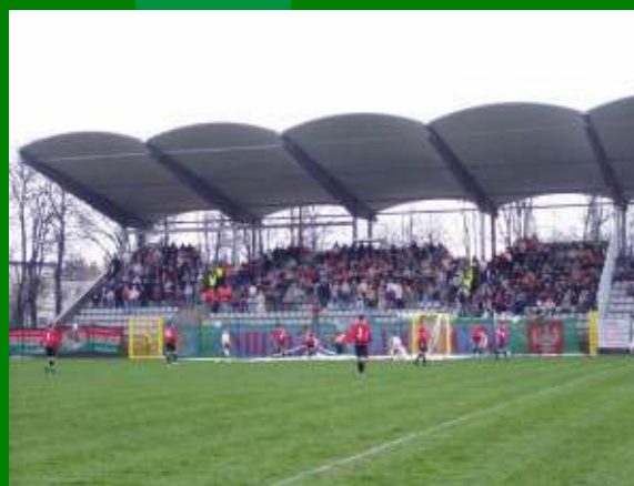
Stadion Miedzi Legnica